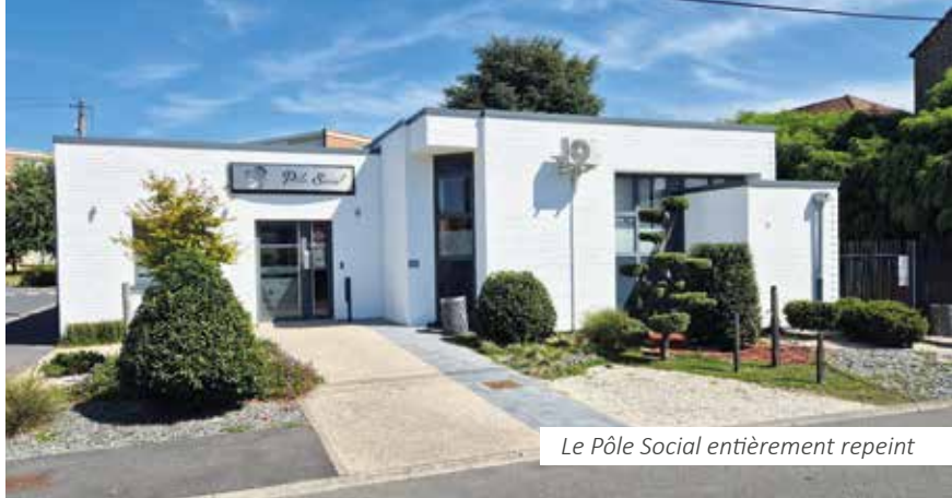
Le Pôle Social entièrement repeint

Ces travaux estivaux permettent ainsi d'offrir un cadre de vie agréable et sûr.